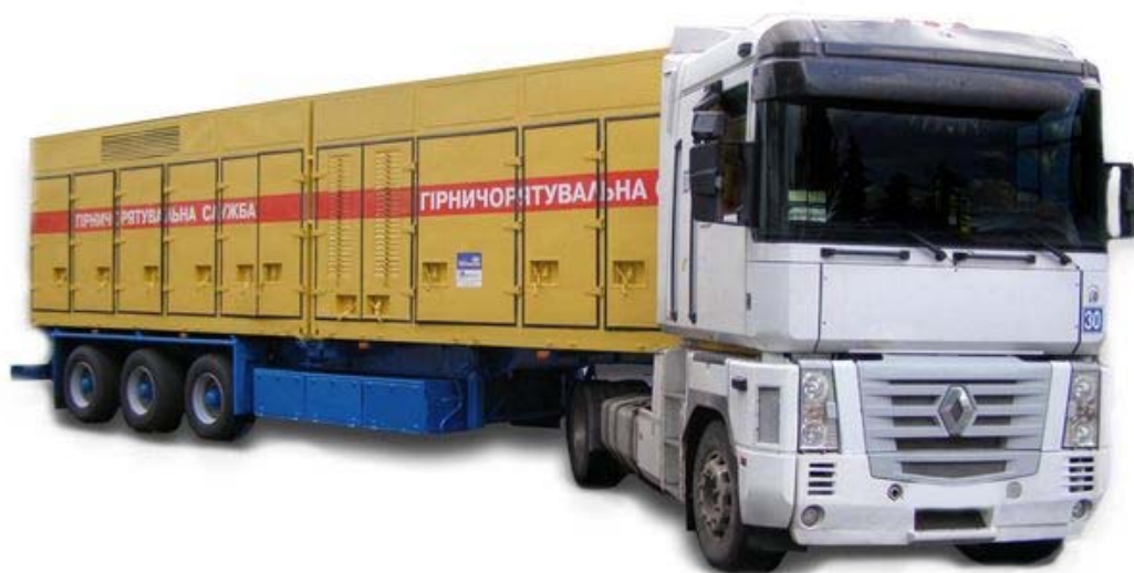
Рисунок 1 - Станция азотная мембранная винтовая передвижная

тельный мембранный блок, в котором на молекулярном уровне происходит разделение воздуха на азот потребителю и пермеат (воздух с повышенным содержанием кислорода) сбрасываемый в атмосферу.