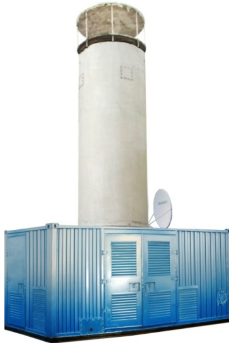
Рисунок 2 - Установка компрессорная газопутилизационная УКГ-5/8

Установка компрессорная газопутилизационная УКГ-5/8 (рис. 2) предназначена для утилизации шахтного газа действующих и закрытых шахт посредством сжигания его в специальной камере и предотвращения этим выделения в атмосферу вредного парникового газа - метана или его подачи на оборудование для энергетического применения (получения электричества и тепла).