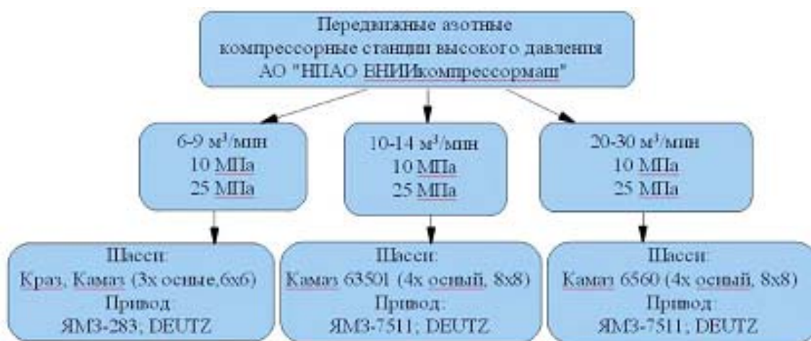
Рисунок 4 - Классификация азотных компрессорных станций высокого давления

Для обеспечения потребностей в сжатом азоте предназначены передвижные станции СДА разработки АО «НПАО ВНИИкомпрессормаш» концерна «Укрросметалл», отличающиеся наличием разделительного мембранного блока. Основной ряд азотных компрессорных станций приведен на рис. 4.