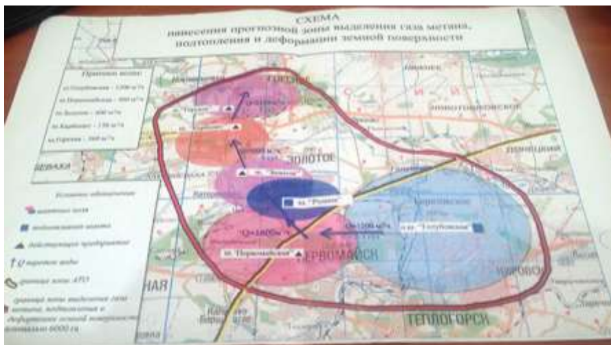
Рисунок 4 – Схема нанесения прогнозной зоны выделения газа метана, подтопления и деформации земной поверхности

году из химзавода был выток 50 тонн монохлорбензола – это было сильнейшее отравление.