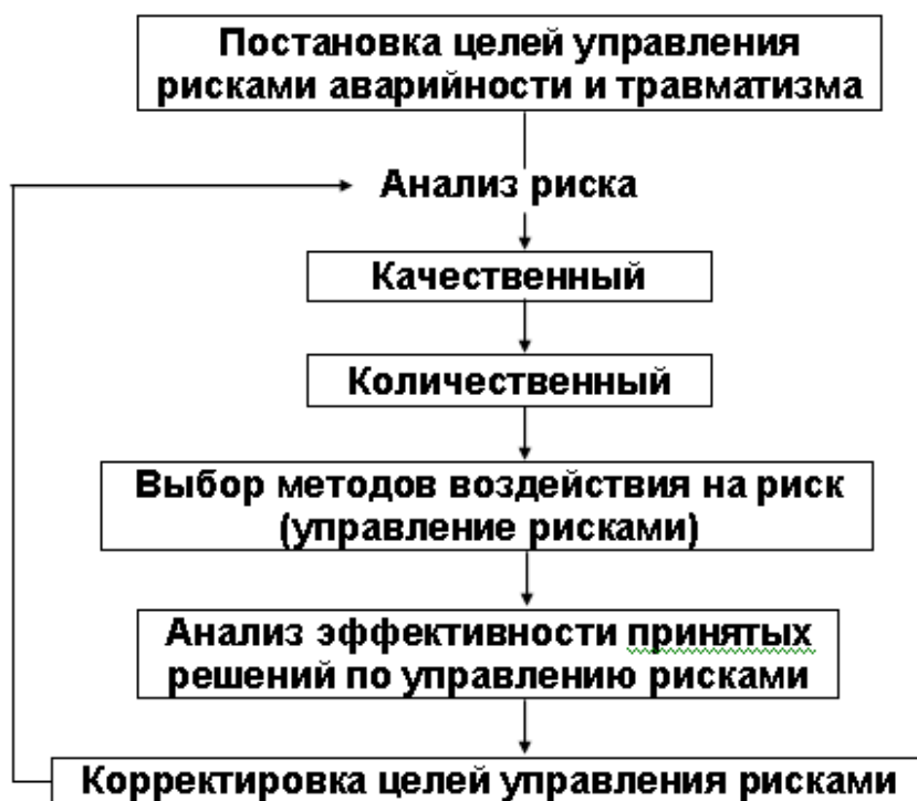
Рисунок 2 – Этапы управления рисками в СУПОТ и СПАЗ угольного предприятия

б) определение и анализ перечня аварий (которые можно характеризовать, как более масштабные аварийные ситуации, требующие принятия специальных мер (ввода в действие плана ликвидации аварий (ПЛА), вызова на шахту подразделений ГВГСС, задействование дополнительного медицинского персонала и т.д.)), и уточнение их типа, места возникновения и характера, подлежащих изучению на предмет снижения риска возникновения и сложности ликвидации.