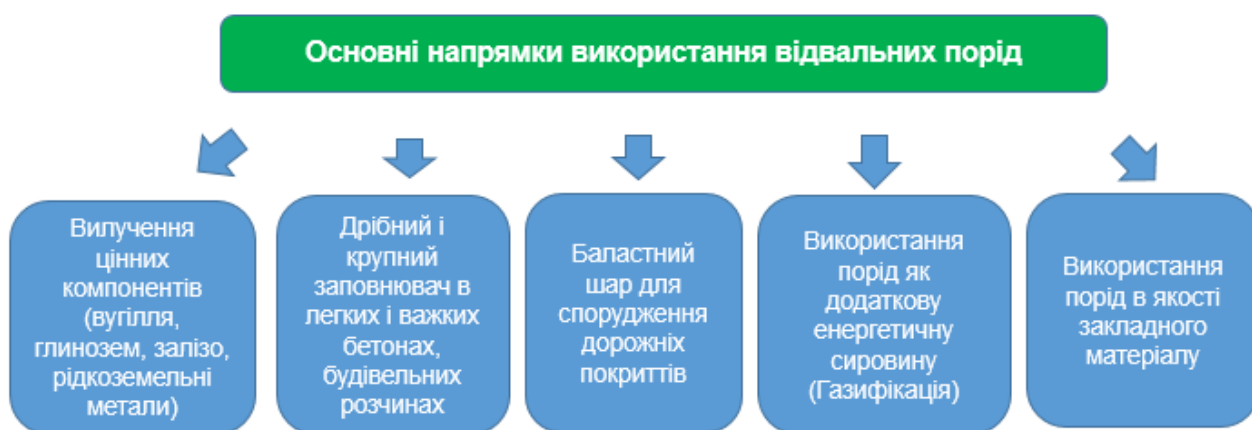
Рисунок 3 – Основні напрями промислового поводження з відвальними породами

Освоювати породні відвали доцільніше на діючих шахтах, адже там створені головні умови – підведені енергопостачальні та водопостачальні мережі, проведені транспортні сполучення.