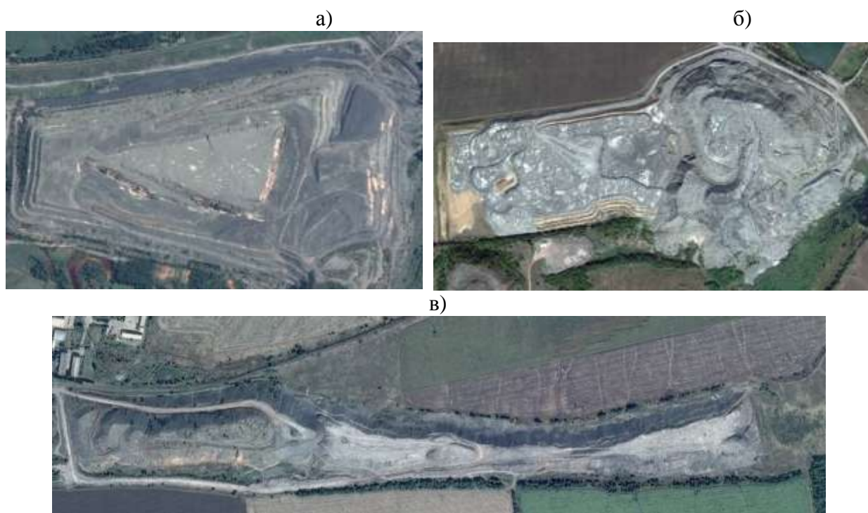
а – породний відвал ш. Межирічанська ДП «Львіввугілля» (61,2 га); б – породний відвал ш. Стаханова ДП «Красноармійськвугілля» (68,6 га); в – породний відвал ш. ім. М.І. Сташкова ПАТ ДТЕК «Павлоградвугілля» (35,9 га)

Таким чином за щільністю розташування та місцем утворення породних відвалів їх можна згрупувати та систематизувати у 8 окремих райони: Павлоградський, Добропільський, Покровський, Вугледарський, Торецький, Лисичанський, Червоноградський та Нововолинський. На рис. 1 представлені найбільші породні відвали (плоска форма) за займаною площею.